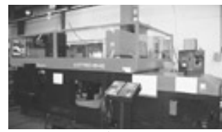
無人ベンディングライン ASTRO-540

ISO取得支援事業や生産管理 ソフト開発事業、券売機・自動 出札機等の高精度板金加工 の製造を行う。